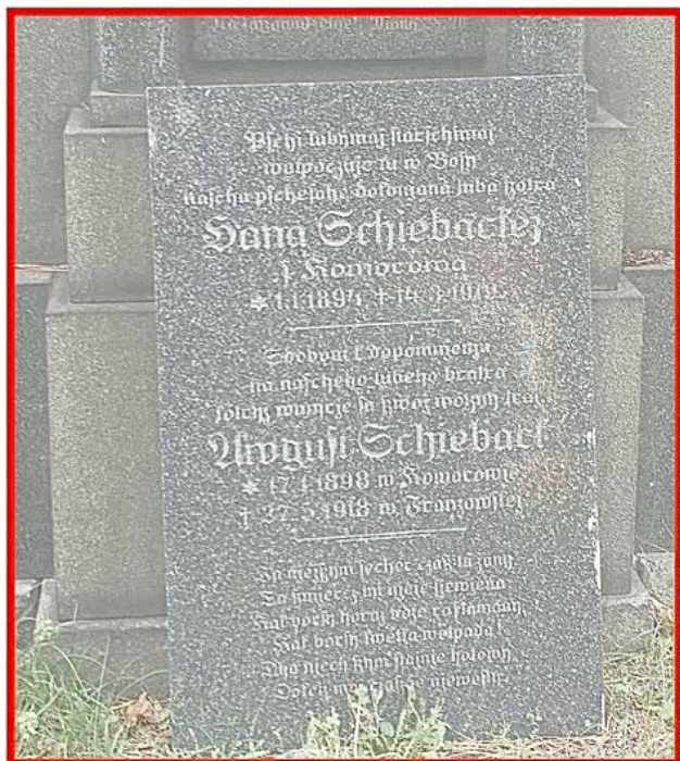
Sorbische Grabplatte auf dem alten Friedhof