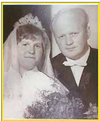
(am 16.05.1970 in Pöbneck – Thüringen)

An dieser Stelle übermitteln Gemeinderat und Gemeindeverwaltung dem Jubelpaar nochmals die herzlichsten Glückwünsche.