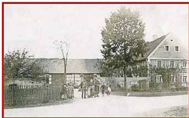
Schiebacks Grundstück Nr. 58 im Jahre 1911

1924 bewohnte das Grundstück Nr. 58 Ernst Schieback. Bei der Volkszählung 1932 erscheint unter der Hausnummer 58 der Name Schieback nicht mehr.